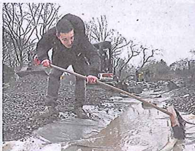
Wie in der Wetterau: Basaltbach auf Magerwiese.