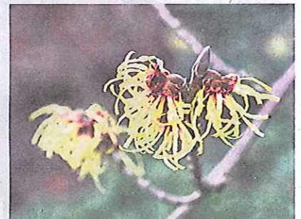
Fusselig und schön: Chinesische Zaubernuss.