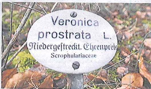
Hat blaue Blüten und keinen Wikipedia-Eintrag: Veronica prostrata.

ling aussehen soll. Viele Pflanzen halten sich noch unter im Herbst gefallenem Laub versteckt. So wie der Riesenwurmfarn – nur ein altes Emailschild verrät seine Anwesenheit.