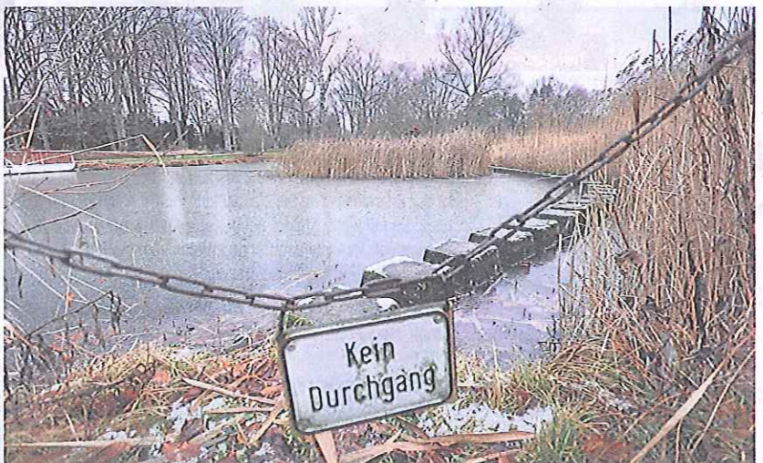
Um Eisvögel anzulocken, leben im Weiher seit letztem Jahr über 2000 neue Fische: leckere Moderlieschen.